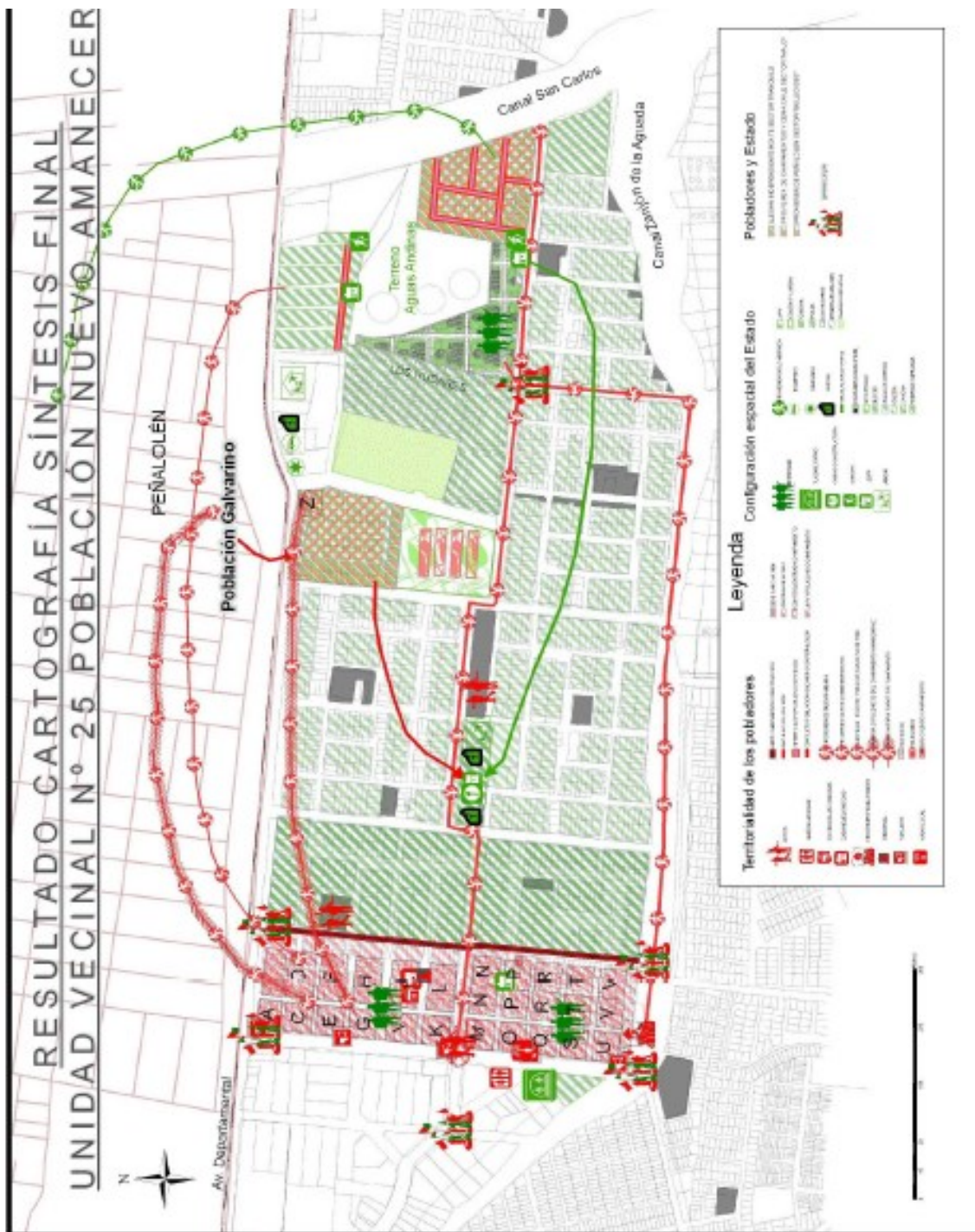
Imagem 3: Configuração espacial exercida após o período da Unidade Popular (1970-1973) na Unidad Vecinal nº 25, ou Población Nuevo Amanecer .