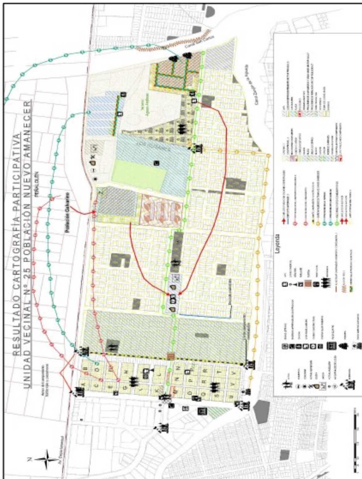
Imagem 2: Territorialidade dos moradores no Campamento Nueva la Habana.