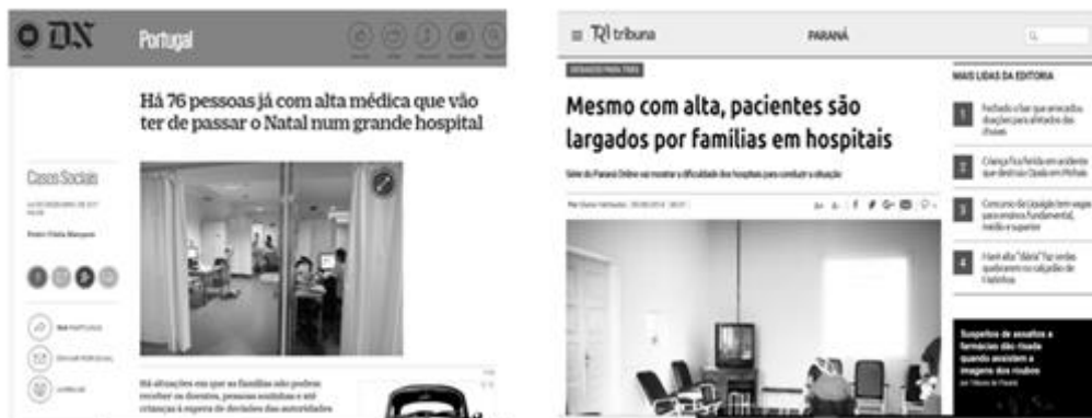
Figura II: Reportagens brasileiras e estrangeiras que trataram da questão da alta