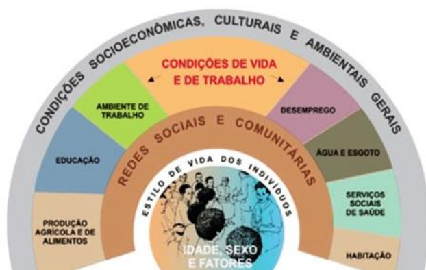
Figura IV: Modelo de DSS adotado no Brasil

Em 2006, foi criada a Comissão Nacional sobre Determinantes de Saúde (CNDSS), vinculada a Fundação Oswaldo Cruz (Fiocruz), através de decreto presidencial. Ela é composta por dezesseis especialistas e personalidades. Segundo a cartilha da própria CNDSS, “sua criação e composição expressam o reconhecimento de que a saúde é um bem público, a ser construído com a participação solidária e de todos os setores da sociedade brasileira”.