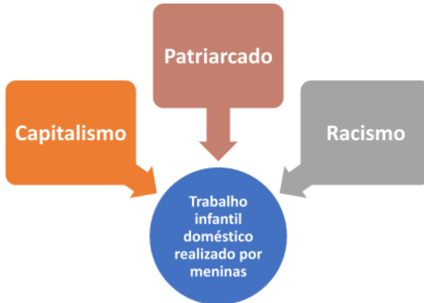
Figura 1. Fatores que influenciam no trabalho infantil doméstico realizado por meninas